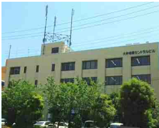
本牧保税蔵置場(K I F C) (11,537㎡)