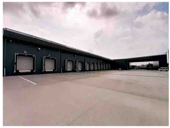
群馬ターミナル倉庫 (3,740㎡)