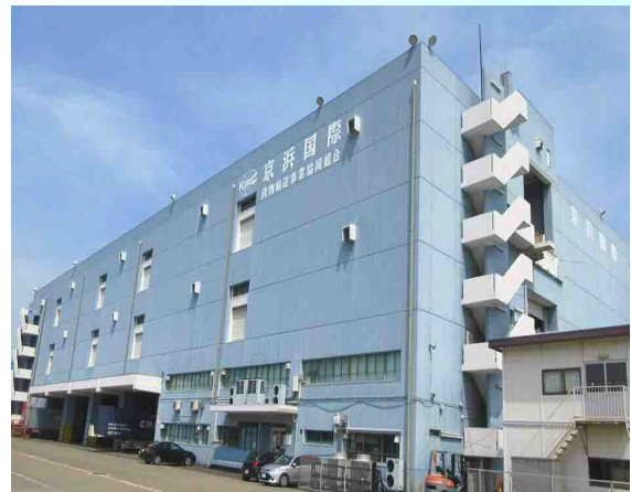
本牧保税蔵置場(K I F C) (11,537㎡)