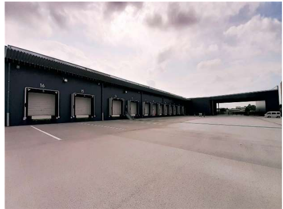
群馬ターミナル倉庫 (3,740㎡)