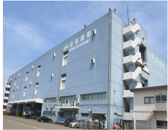
本牧保税蔵置場(K I F C) (11,537㎡)